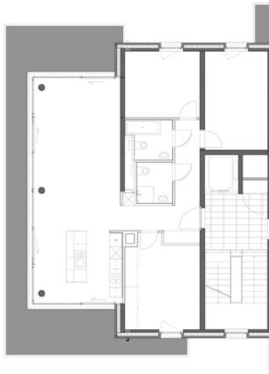
Appartement type Rez